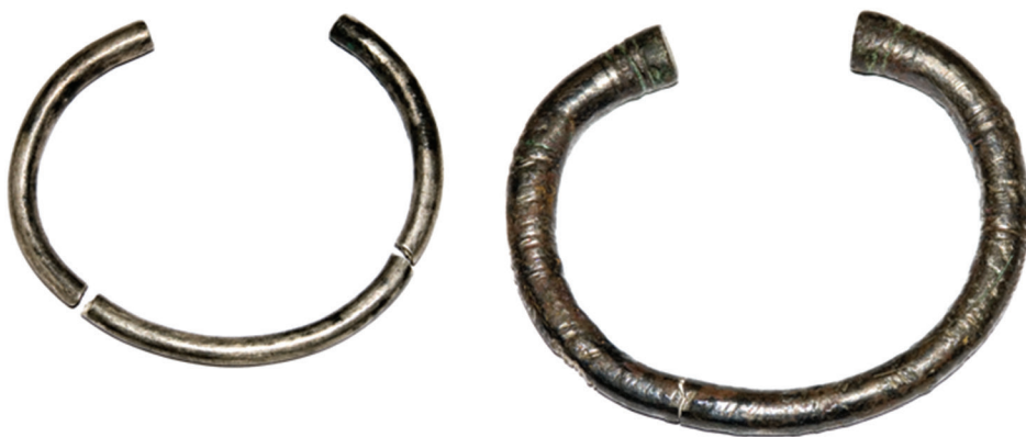
Աղյուսակ XII – 1, 2