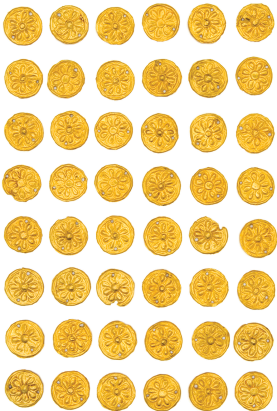
Աղյուսակ IV - 1