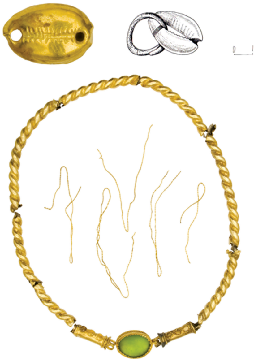
Աղյուսակ VI – 1, 2, 3