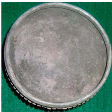
Աղյուսակ XI – 1, 2, 3