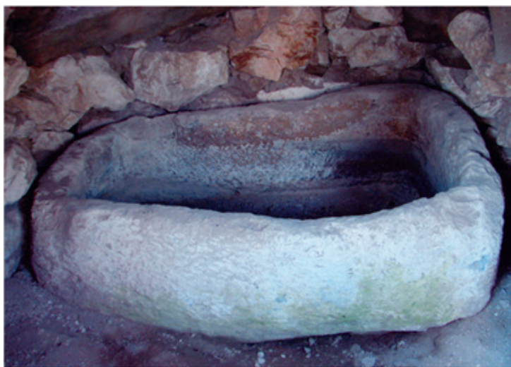
Աղյուսակ I – 1, 2