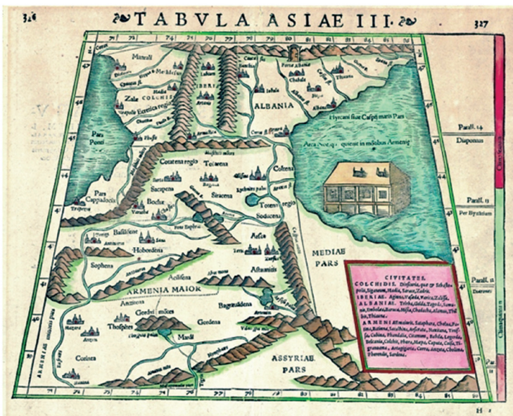
Fig. 3 – Ptolemy's "Third Map of Asia" from the Geographia, printed in 1531