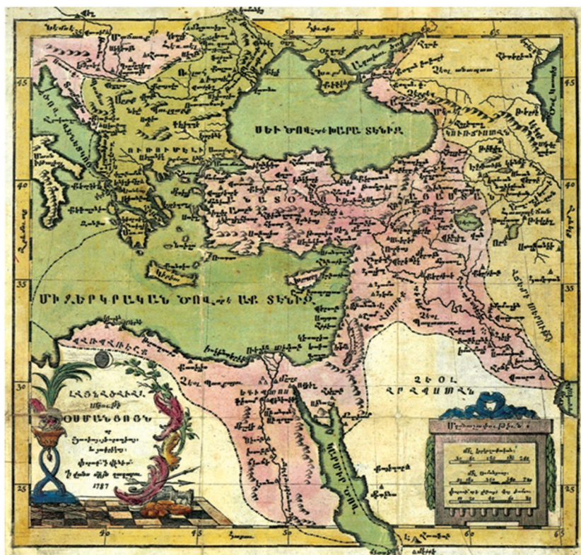
Fig. 14 – The map of the Ottoman Empire was printed in the Venetian Armenian Monastery of St. Lazzaro in 1787