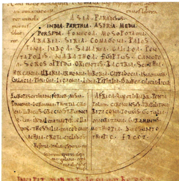
Fig. 4 – A typical T-O type European world map by Venerable Bede, from the 11th century England