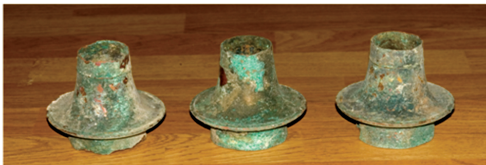
Աղյուսակ II – 1, 2, 3