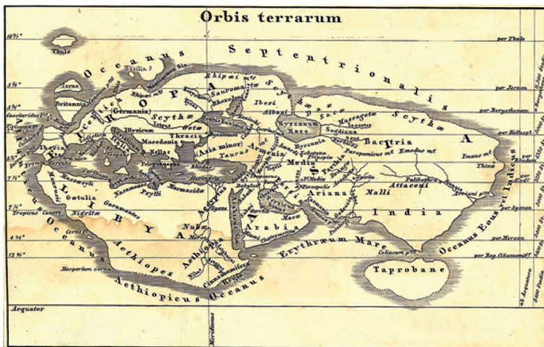
Fig. 1 – The World Map of Eratosthenes

С середины XVIII в. активную роль в развитии армянской картографии начинает играть конгрегация мхитаристов, в числе лучших образцов, выпущенных трудами членов конгрегации были карты Обетованной земли (1746 г.), исторической Армении (1751 г. и 1786 г.) и Османского государства (1787 г.) (рис. 14), а в 1849 г. был издан первый большой армянский атлас с двенадцатью цветными таблицами.