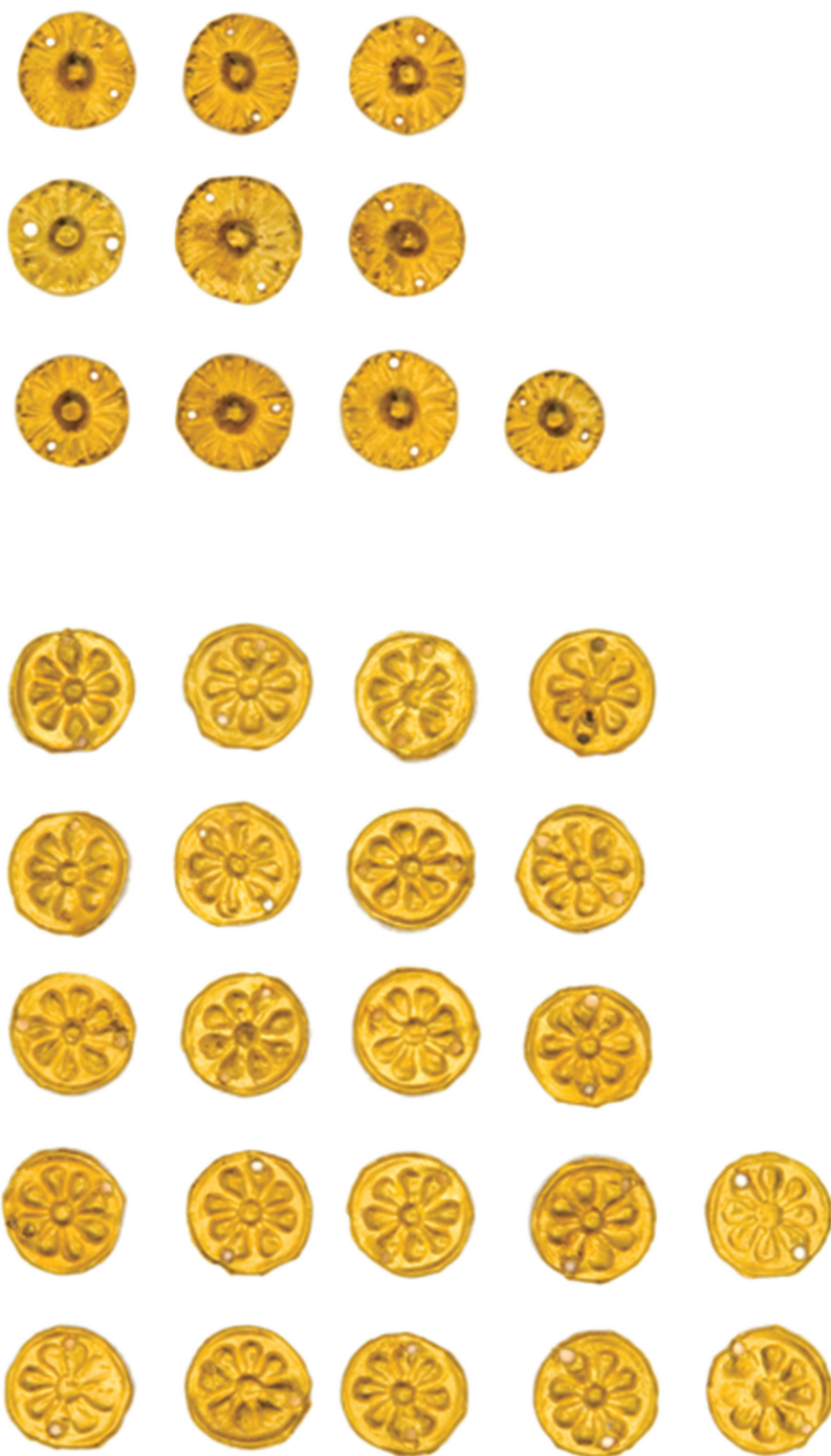
Աղյուսակ V – 1, 2