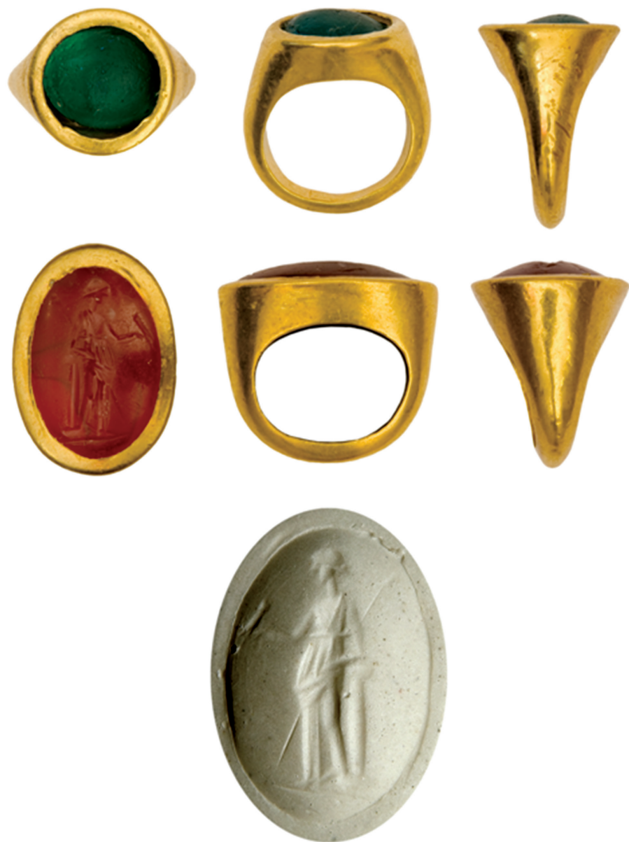
Աղյուսակ VIII – 1, 2, 3, 4, 5, 6, 7