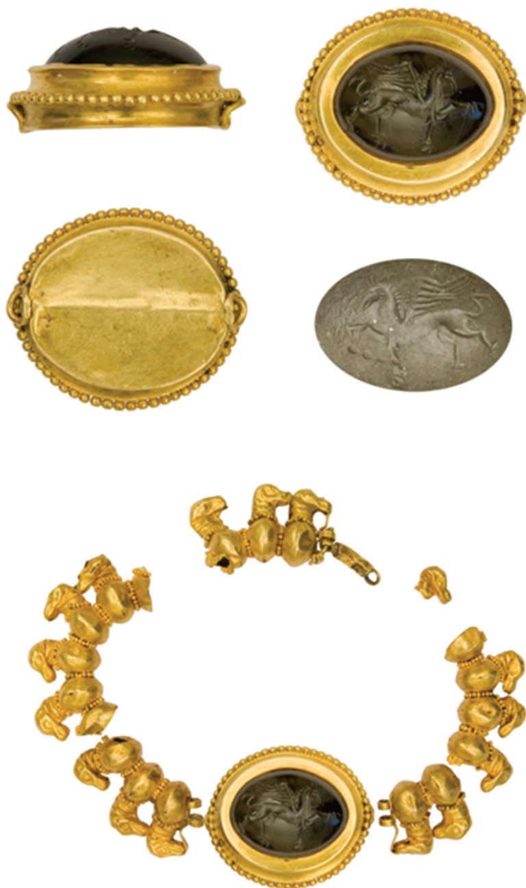
Աղյուսակ VII – 1, 2, 3, 4, 5