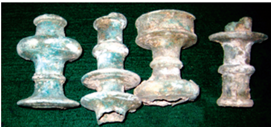
Աղյուսակ III – 1, 2, 3