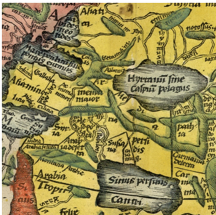
Fig. 2 – Detail form the World Map of Ptolemy