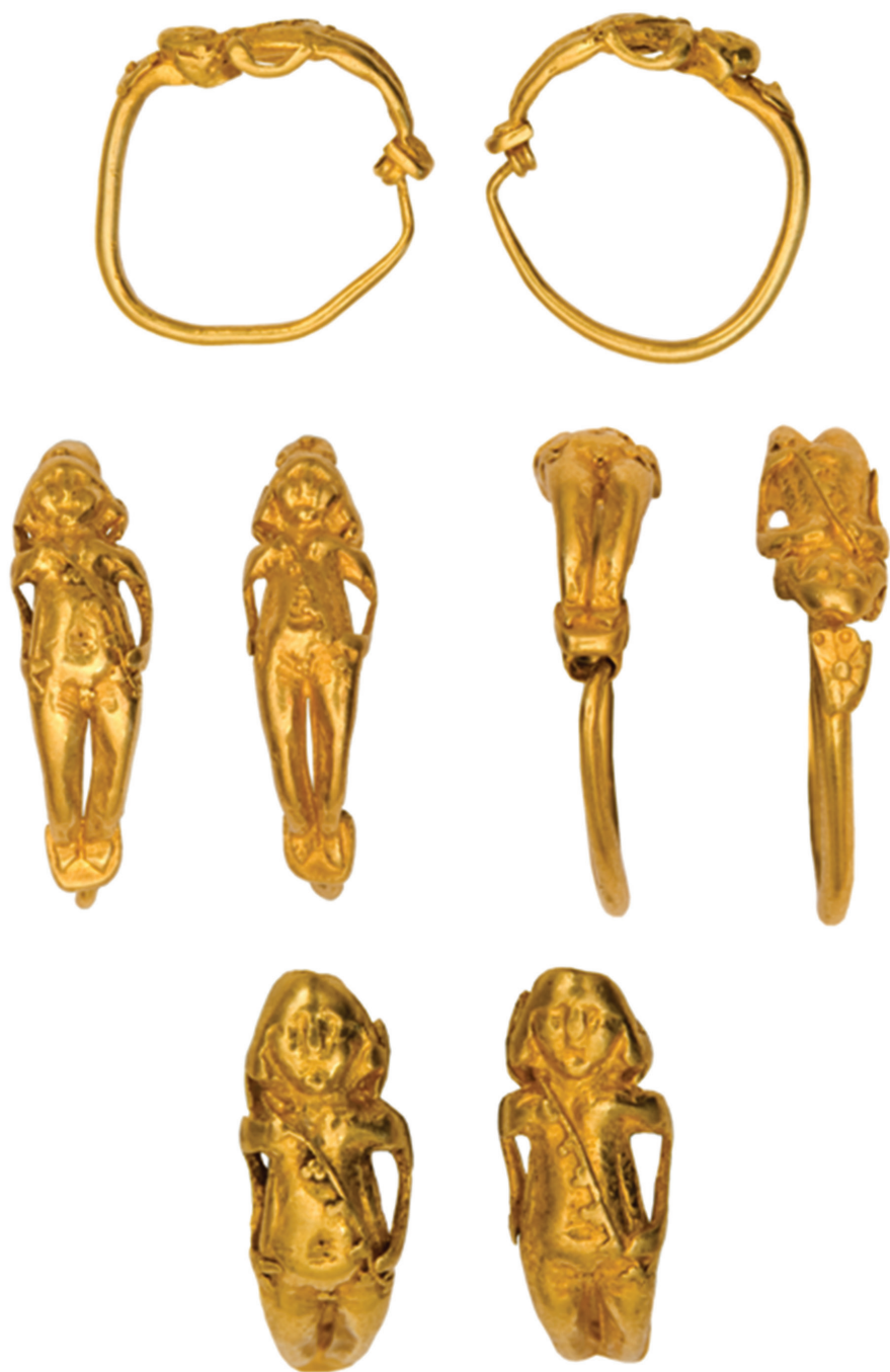
Աղյուսակ IX – 1, 2, 3, 4