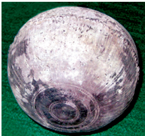
Աղյուսակ X – 1, 2, 3, 4