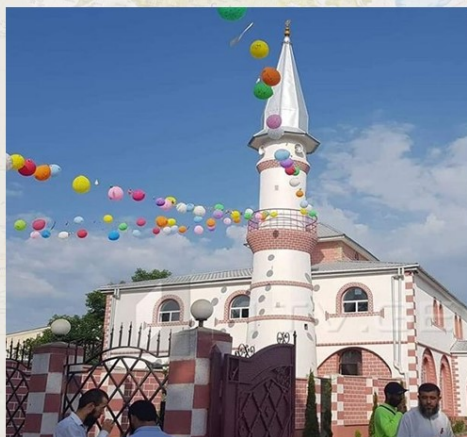
Ղարաջալայի սուննիական մզկիթը