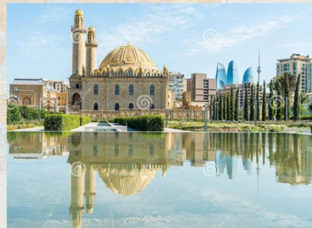
Թեգե-լիի մզկիթը Բաքվում