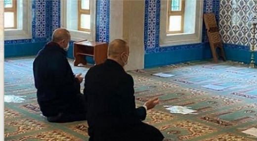
Ալի Էրբաշ Կրոնի գործերի նախագահություն Դիյաների տնօրեն