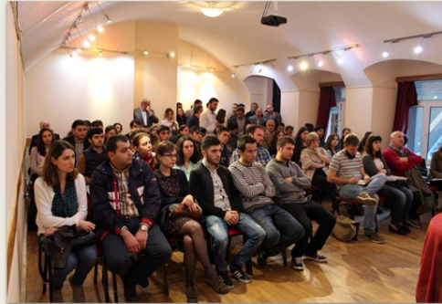
Պանկիսի սալաֆիական համայնքը