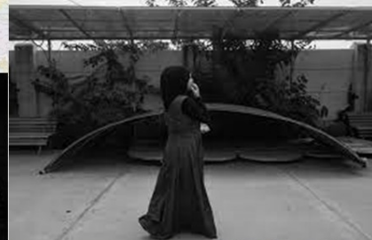
Մառնեուլիի Խանումա Չաիրա մադրասա