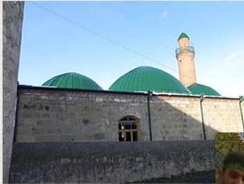
Տալավերի գյուղի մզկիթը