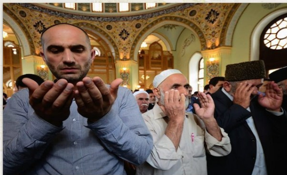
Հեյդարի մզկիթ, Բաքու