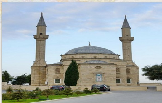
Շեհիդեր թուրքական մզկիթը