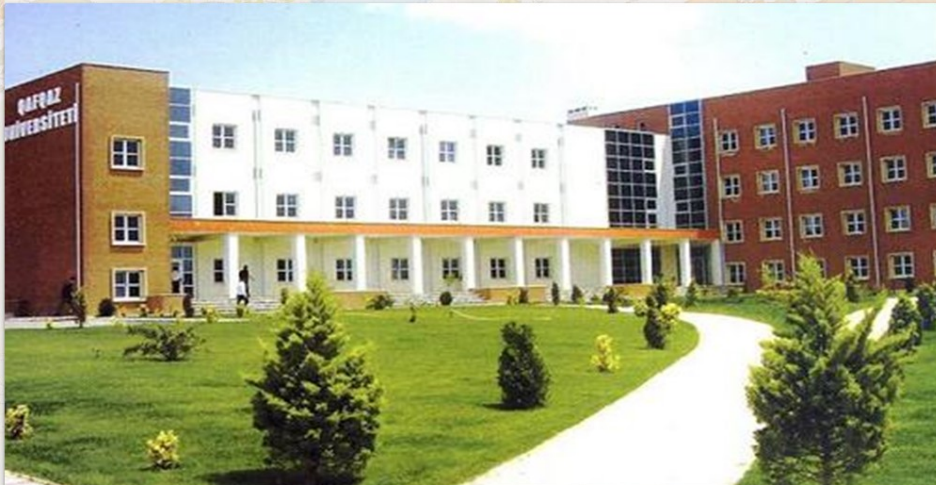
Գյուլենական Կովկաս համալսարան 1993-2017