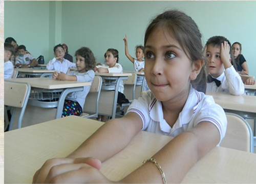
2016թ. Բաթումում բացվեց առաջին թուրքական պետական դպրոցը