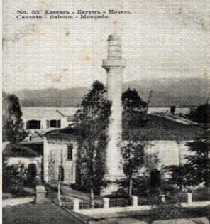
Բաթումի Ազիզիե մզկիթը 1886-88 թթ.