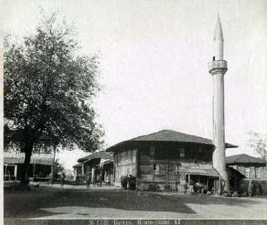
Մուֆթի- Մագլասին ջառմի 1895 թ.