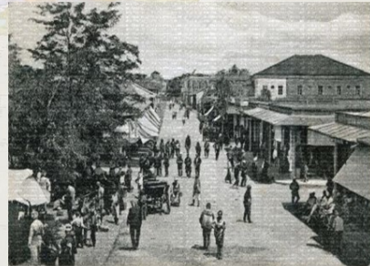
Բաթումի թուրքական շուկան 1860-ական թթ