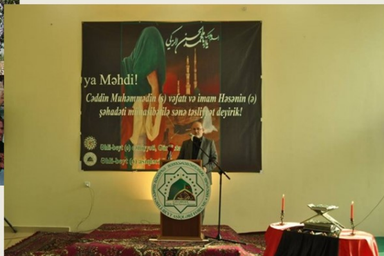
Ահլ ալ-Բեյթ մշակութային կենտրոն