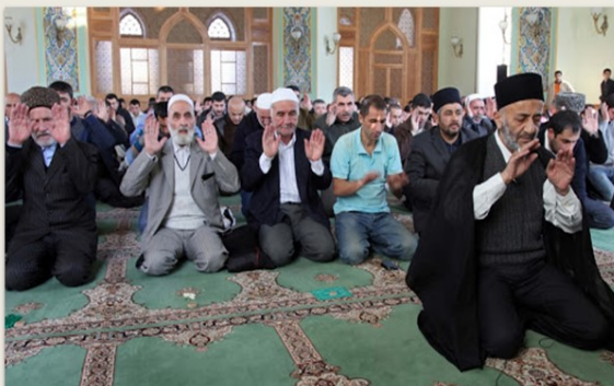
Ադրթք սուլֆիական նակշբանդիական մզկիթում, Բաքու, Զարադադ