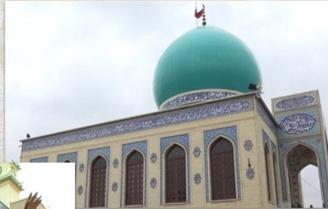
Մառնեուլի շիայական մզկիթ