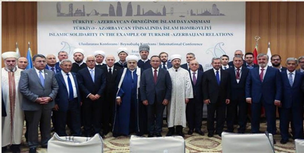
Դիյաներթի համագործակցությունն Ադրբեջանի հետ