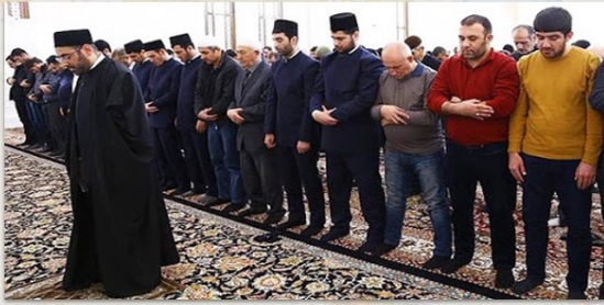
Սուլեյմանիա համալսարանի աղոթք, Զեյդարի մզկիթ, Բաքու