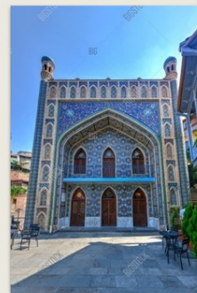
ԹԲԻԼԻՍԻ ԶՈՒՄԱ ՄՉԿԻԹԸ