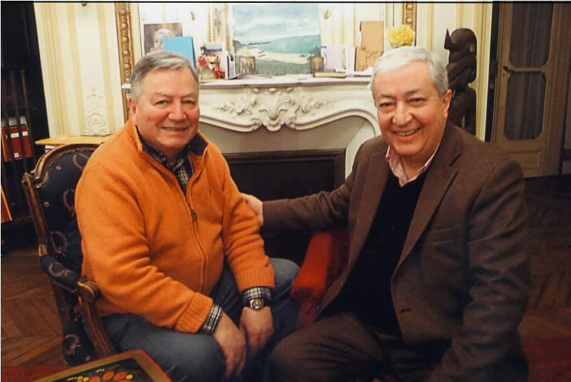
Անվանի գրականագետ Ավիկ Իսահակյանի հետ Ժան-Պիեռ Մահեի բնակարանում (Փարիզ, 2015թ.)

կանն է և «Մատեան ողբերգութեան» պոեմի ծանոթագրությունների համահեղինակը: